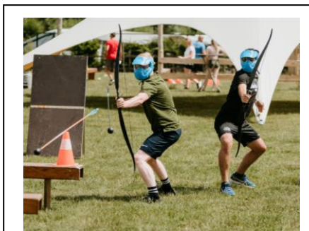
Archery - Tag