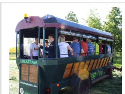
Locatram + frisbee golf Extra € 10 pp / + 40 min