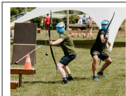
Archery - Tag Extra € 10 pp / + 20 min

Onze programma's kunnen nog uitgebreid worden met extra activiteiten en catering. Prijzen zijn per persoon en excl. BTW